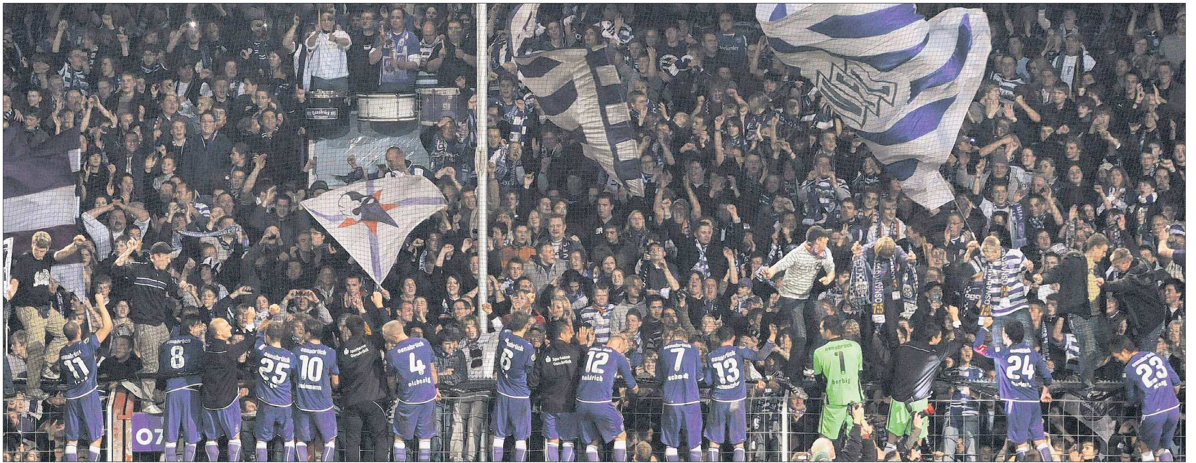
„Alle auf den Zaun“: Die VfL-Pokalhelden kamen der Aufforderung der Fans aus der Ostkurve gern nach und entfachten eine Stimmung, wie sie auf der Dortmunder Südtribüne herrscht.